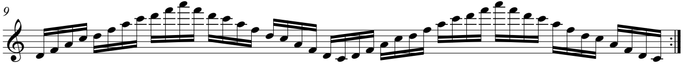
Basic scale pattern